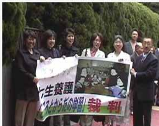
原告団を代表して裁判所前で 2005年5月12日提訴の日に