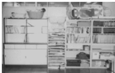
(教材を「没収」されたあとの保健室)