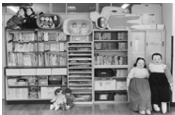
(教材を大切に保管していた保健室)