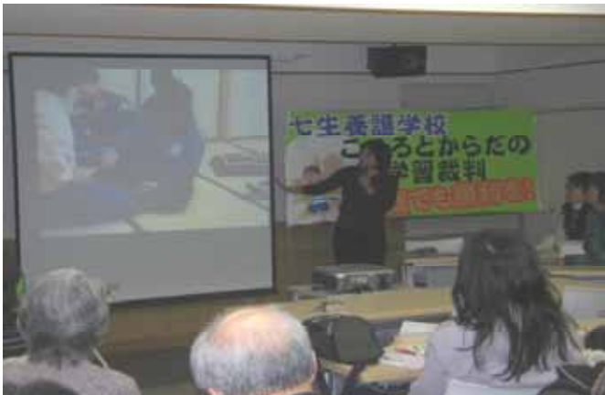
< 10.2.4高裁第3回口頭弁論後の報告集会で >